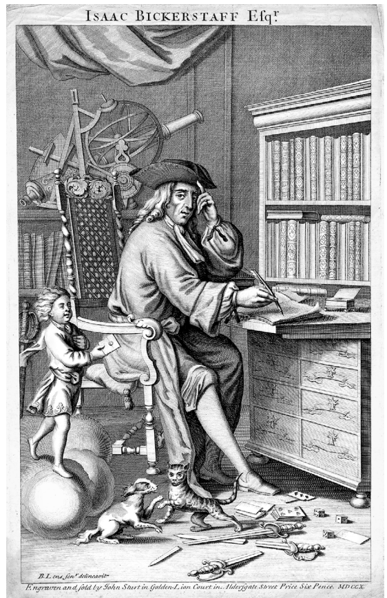
Abb. 3 Die Figur des Isaac Bickerstaff, Esq.: Frontispiz zu einer Buchausgabe des Tatler , London (ohne Datierung)

Obwohl der Begriff des Zensors eine eher autokratische Verfahrensweise nahelegt, ist das Klassifikationsspiel, das sich auf dieser Grundlage entfaltet, durchaus vielstimmig, d. h. auf Publikumsbeteiligung angelegt. Die gewöhnliche Dramaturgie beginnt damit, dass Isaac Bickerstaff von einem_r Leser_in über bestimmte merkwürdige Vorkommnisse des gesellschaftlichen Lebens unterrichtet wird. Seine Dienstleistung besteht dann darin, diese Erscheinungen in seiner Klassifikation des Sozialen unterzubringen. Bickerstaff berichtet aber auch von vorgeblichen Einordnungsproblemen und bittet die Leser_inenschaft um Mithilfe bei der Klassifizierung ungewöhnlicher Charaktere: «It