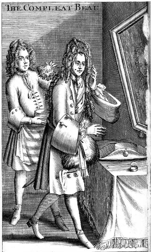
This vain gay thing sets up for man, But see to fate attends him The powdering Barber first began, The Barber Surgeon ends.