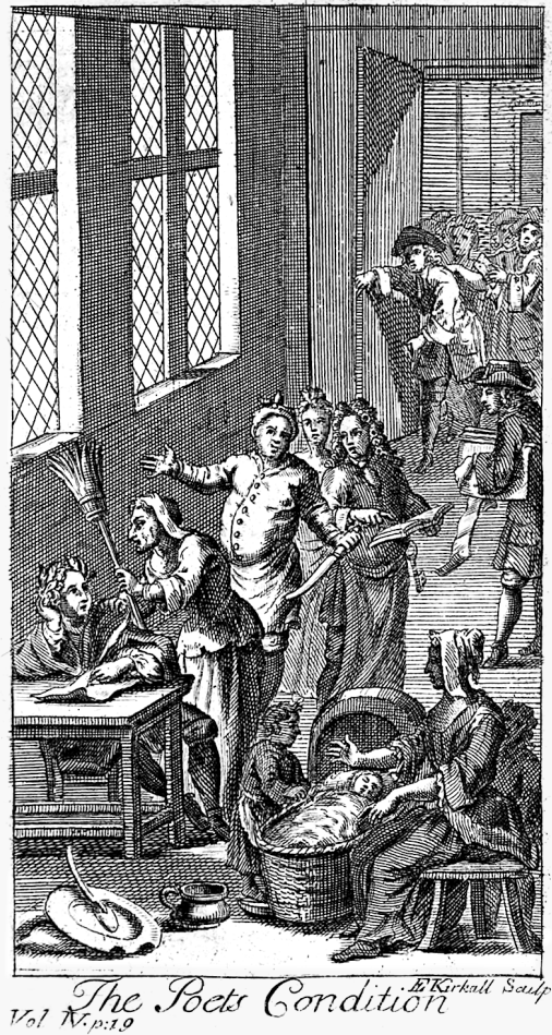
Abb. 6 The Poets condition , aus: The Works of Mr. Thomas Brown, Fourth and last Volume , London 1730

Als literarischer Selbstunternehmer hatte Brown ein gutes Gespür für das Funktionieren der neuen, kapitalistischen Ökonomie, die in seinen Schriften unter dem Namen «Trade» firmiert. In seinen Amusements spottet er über die neue merkantile Klasse und ihr «mystery of Trade»: «A Term unintelligible to Foreigners, and that none truly understand the Meaning of, but those that practice it.» 41 Zugleich lässt er seinen indianischen Weggefährten (der offenbar als Fachmann für Idolatrie betrachtet wird) eine Art Fetischkritik der Wertvergesellschaftung formulieren: «What cannot you be content, says our