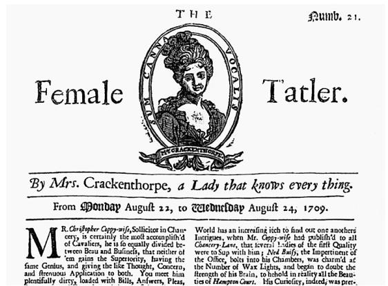
Abb. 5 The Female Tatler , Nr. 21 (erste Ausgabe mit Crackenthorpe-Signet)

Überhaupt erscheinen die Identitätskategorien im Female Tatler als weniger fest gefügt, sie stellen, wie Anthony Pollock bemerkt hat, keine «unvermeidlich bindenden ontologischen oder essentiellen Charakteristika» dar; sie werden eher im Sinn arbiträrer, wenngleich «gesellschaftlich notwendiger Konstruktionen» eingesetzt. 32 Dies gilt allerdings eher für die Geschlechterdifferenz, nicht so sehr für die Statusunterschiede. Darin hebt sich der Female Tatler am deutlichsten von Steeles und Addisons Blatt ab. Die liberale, whigistische Position des Tatler erlaubt eine Lockerung der Standesgrenzen, fixiert und naturalisiert aber gleichzeitig die Geschlechtergrenzen; die konservative Tory-Position des Female Tatler lässt sich ein Spiel mit den Geschlechtsrollen gefallen, erweist sich aber humorlos, wenn es um die gesellschaftliche Hierarchie geht. Auf diese Weise geschieht es, dass ein Kaffeehaus-Magazin vor allem um die Feinheiten der geschmacklichen und sexuellen Identitäten kreist, während eine Frauenzeitschrift die Frage des sozialen Unterschieds aufwirft.