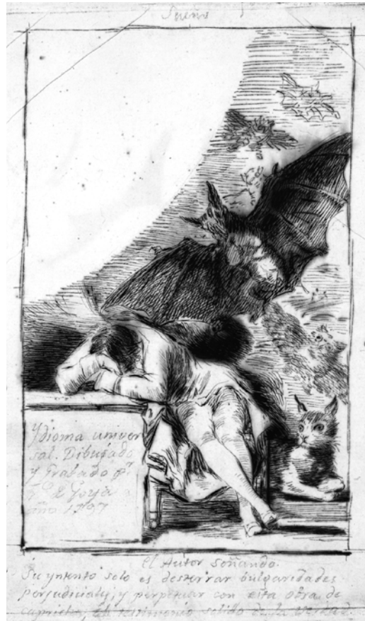
Abb. 3: Francisco de Goya: Ydioma universal , Federzeichnung, 1797

Wenn Goya sich auf die Seite dieses Anderen der klassifikatorischen Repräsentation, auf die Seite des Monsters schlägt, so geschieht dies nicht, wie bei Chasaignon, in einer Hyperproduktion von außergewöhnlichen Gestalten, sondern vielmehr in einer Weise der Darstellung, die am Gewöhnlichen das Monströse