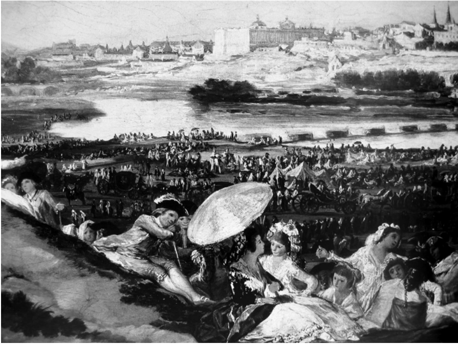
Abb. 4: La pradera de San Isidro , 1788, Museo del Prado, Madrid

lichkeit verhaftet; die symbolischen Kombinationsspiele bewegen sich innerhalb der klassischen Episteme der Repräsentation; dagegen bringt der Rückgang auf das körperlich ›Reale‹ des Monsters, auf das »Dunkel des schöpferischen Grundes« 58 eine neue Form der ästhetischen Wahrnehmung hervor, deren Prinzip, wie Walter Benjamin sagt, nicht die Gestaltung, sondern die »Entstaltung des Gestalteten« ist: »Es ist aller Phantasie eigen, daß sie um die Gestalten ein auflösendes Spiel treibt.« 59